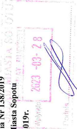
Tabela nr 1 do pkt. 1.1 działu II załącznika nr 6

Zmiany wartości środków trwałych, wartości niematerialnych i prawnych oraz inwestycji długoterminowych (wartość brutto)